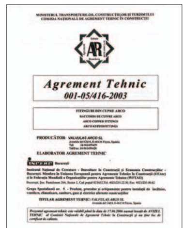
AR AGREMENT TEHNIC IN CONSTRUCTII RUMANIA