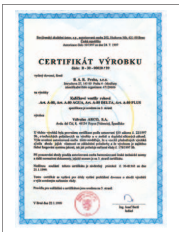
STROJIRENSKY ZKUSEBNI USTAV REPÚBLICA CHECA