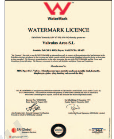
SAI GLOBAL AUSTRALIA