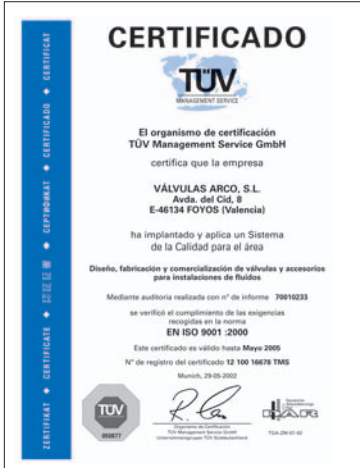
Empresa Certificada ISO 9001