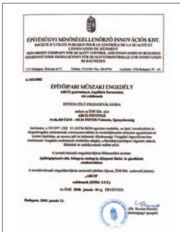
EMI KHT HUNGRIA