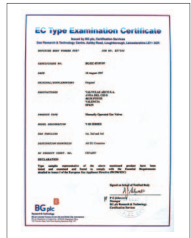
BG PLC REINO UNIDO