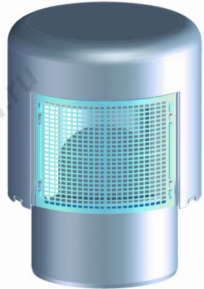
HL 900N (NECO)